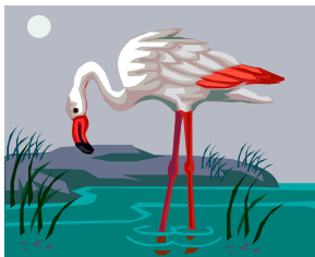
Blue heron (flaman)