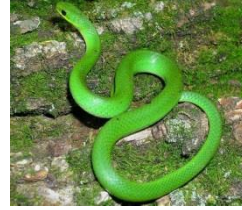
Konpè Koulèv, Zanmi Konpè Sourit.

Pandan konpè Erison ap pale ak Konpè Lapen, li tande yon ti mouvman anba pay la. Se te Konpè Koulèv, zanmi Konpè Sourit.