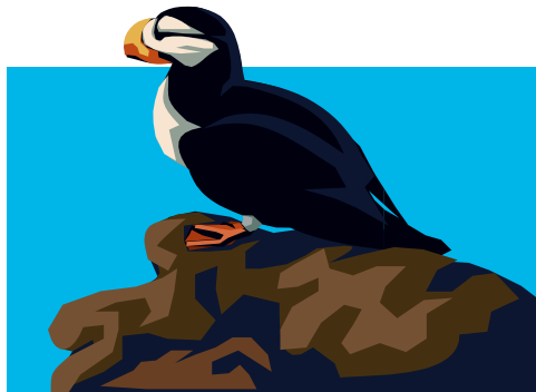
pufflin (yon kalite Kana)

Tibebe yo kache kote ki an sekirite . Manman yo ak papa yo ale peche anpil pwason pou pote ba yo, kounye a se sezon ete, fò yo manje. Yo grandi. Apre sa yo kite kote yo te ye a pou lapremyè fwa . Yo eseye vole sot sou kan mòn yo pou yo lage kò yo anba nan lanmè a.