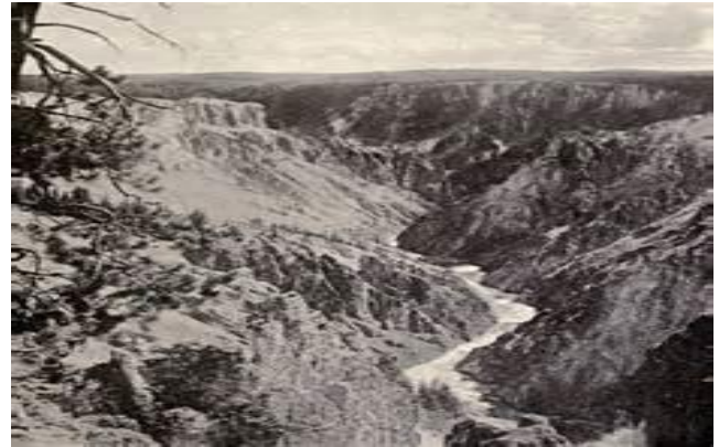
Rivyè Ble Gri nan vale a

Kesyon: Pouki sa Prezidan Roosevelt te vle chita pale ak John Muir?