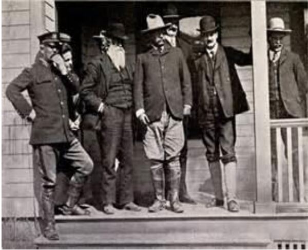
Prezidan Roosevelt ansanm ak diyètè yo.

Roosevelt di yo pou yo fè yon boukan dife . Apre sa, l al dòmi. Lè li reveye, li tande yon bèl ti mizik yon èmit, zwazo ki renmen ale nan flè migè yo, ap chante. Se te zwazo prefere li a sa. Prezidan an santi l ap mouri ak grangou. Li pran yon bon dejnen ki genyen vyann kochon ak sis ze ladan l. Muir eksplike Prezidan an kouman yon sèl ti grenn pi piti pase yon flokon lanèj te pouse anviwon de mil ane. Grenn yo fè pyebwa sekoya sa yo ki pa leve nan okenn lòt kote nan lemonn, eksepte nan pan Lwès mòn Sierra Nevada a sèlman. Sa te fè je Prezidan laji ak sipriz.